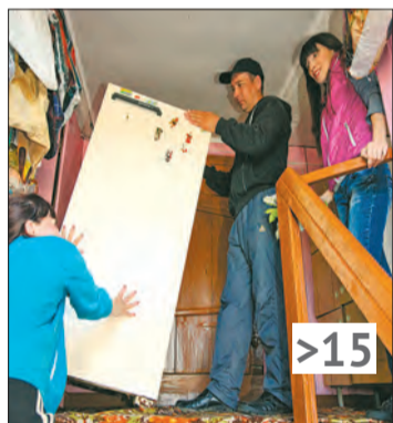
Мультисервис на колесах добрался до глубинки