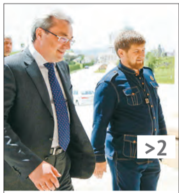
Гайзер и Кадыров обменялись опытом