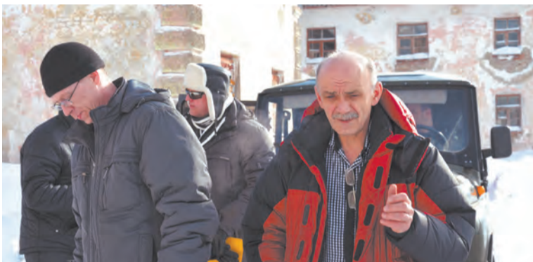
ЖКХ-контроль в действии