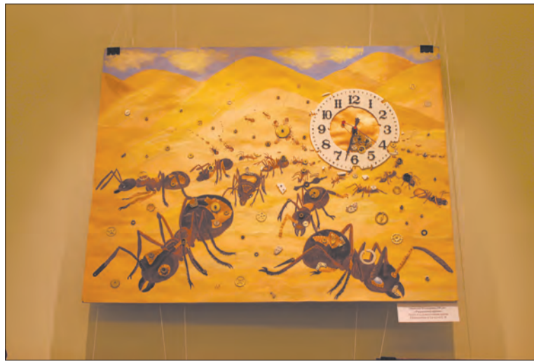
«Украденное время» – работа Екатерины Панковой