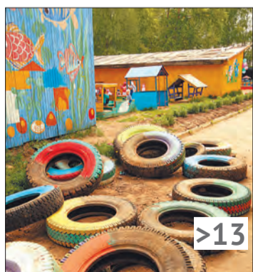
С территории детских садов убирают старые покрышки