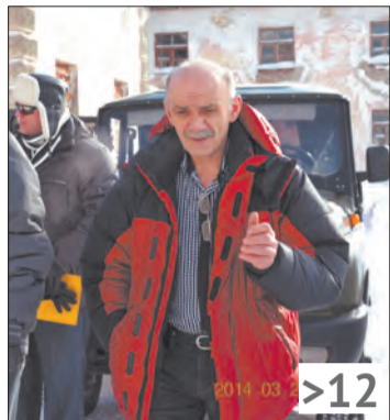
ЖКХ под контролем общественной организации при администрации города