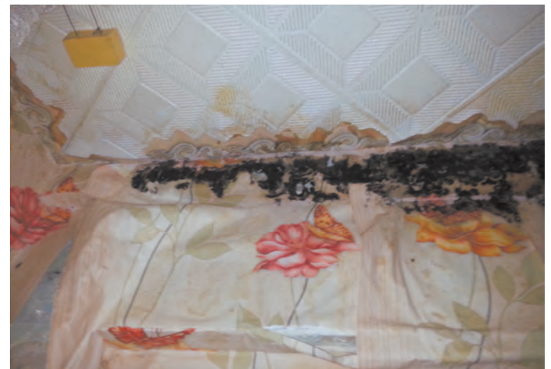
Удручающее состояние квартир